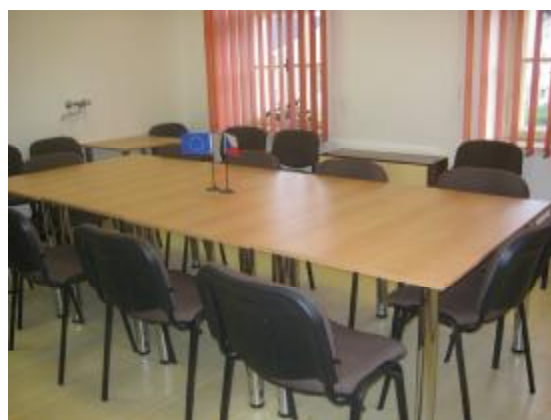
Zasedací místnost kanceláře MAS CHANCE IN NATURE –LAG v Malenicích

Kancelář MAS v rámci projektu KPSS bude využita i pro realizaci SPL. Je nově vybavena (rok 2007) a disponuje všemi potřebnými prostředky pro jednání a administraci celé realizace strategie.