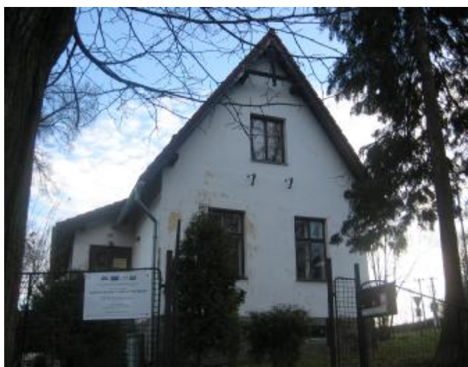
Budova kanceláře MAS CHANCE IN NATURE – LAG v Malenicích