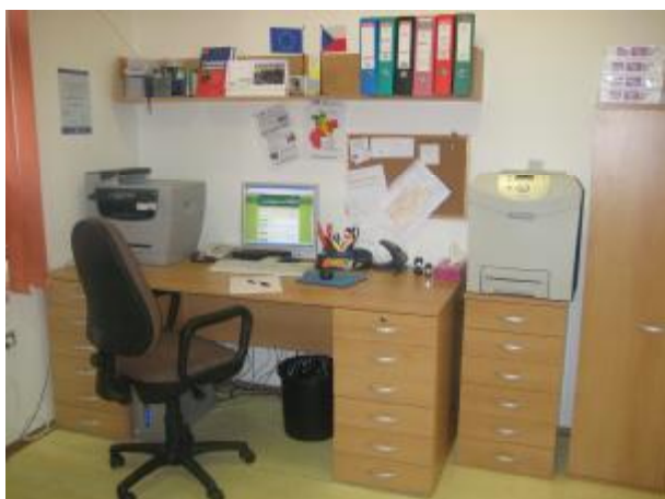
Kancelář MAS CHANCE IN NATURE – LAG v Malenicích